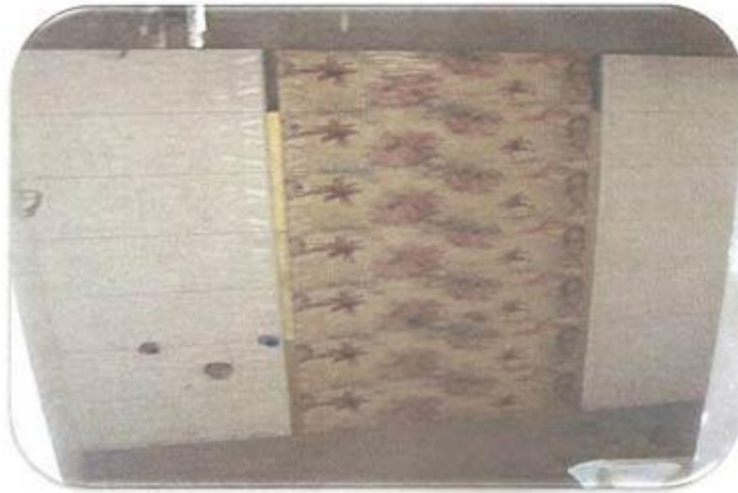
اجرای کاشی سرویس حمام مشترک طبقه ۱۶ واحد